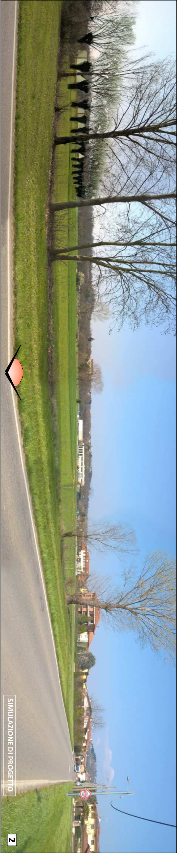
SIMULAZIONE DI PROGETTO