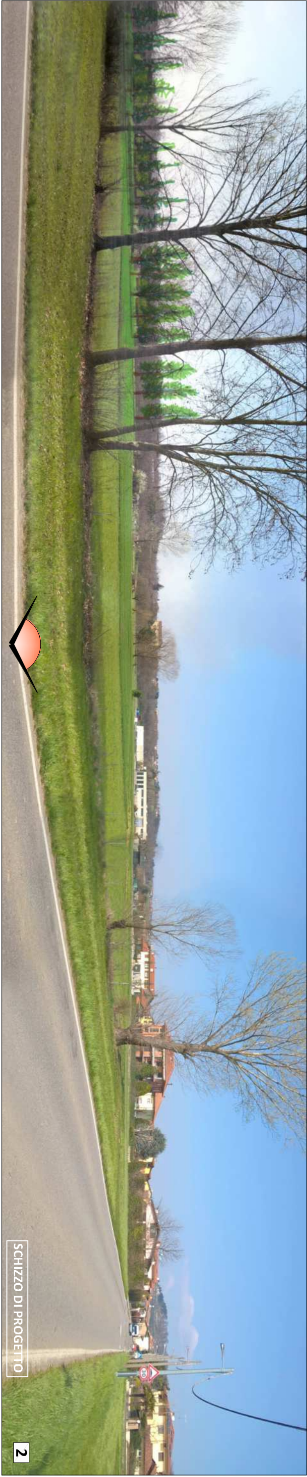
SCHIZZO DI PROGETTO